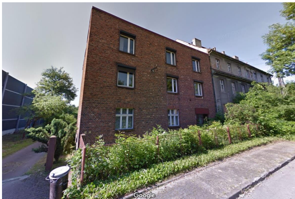
Rysunek 8 Budynek z receptorem nr 11 - po prawej stronie drogi w km ~ 550+915

Budynek z receptorem nr 14 – prognoza dla tego budynku wykazała największe przekroczenie 0,9 dB dla roku 2023 i 1,3 dB dla roku 2031. W związku z powyższym przeprowadzono symulację w programie z ekranami wyższymi niż zakładana w projekcie maksymalna racjonalna z punktu widzenia możliwości technicznych wysokość (8m). Symulacja pokazała, że podwyższenie ekranu do nawet do 12m nie wyeliminowało przekroczenia, a zmniejszyło jedynie o 0,4 dB, co pokazuje, że przyjęta wysokość 8m jest to racjonalnie maksymalna efektywna wysokość i dalsze jej podnoszenie nie przynosi oczekiwanych rezultatów w tej konkretnej analizowanej sytuacji wysokościowej. Również dodanie dyfraktora na topie ekranu nie przyniosło wymiernych skutków.