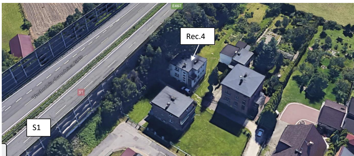
Rysunek 7 Budynek z receptorem nr 4 po prawej stronie drogi w km ~ 549+375.

Budynek z receptorem nr 4 – prognoza na 2023 rok wykazała znikome przekroczenie 0,2 dB, natomiast w 2032 0,8 dB w porze dziennej. Przekroczenie wynika z faktu, że budynek znajduje się w obrębie terenu zabudowy mieszkaniowej jednorodzinnej, dla której prawo przewiduje podwyższony standard akustyczny w dzień (61dB). Standardy obowiązujące na terenach zabudowy jednorodzinnej bardzo trudno dotrzymać w tak bliskiej lokalizacji względem drogi o tak wysokim natężeniu ruchu jak przedmiotowa S1.